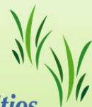
Poverty Week - Coffee Tasting