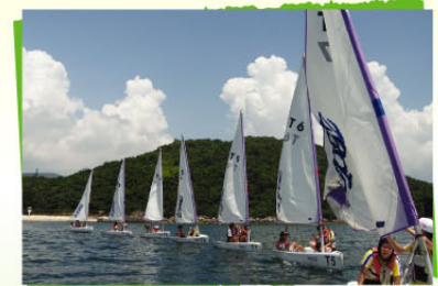
English Sailing Day

Uniform Groups: Red Cross, Boys' Brigade.