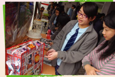
Visual Arts Exhibition