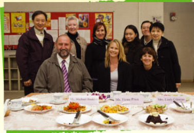
International Culture Week

English Language, Mathematics, Physics, Chemistry, Biology, Combined Science (Chemistry and Biology), Economics, Geography, Information and Communication Technology, Technology and Living (Food Science and Technology Strand), [ Business, Accounting and Financial Studies ]