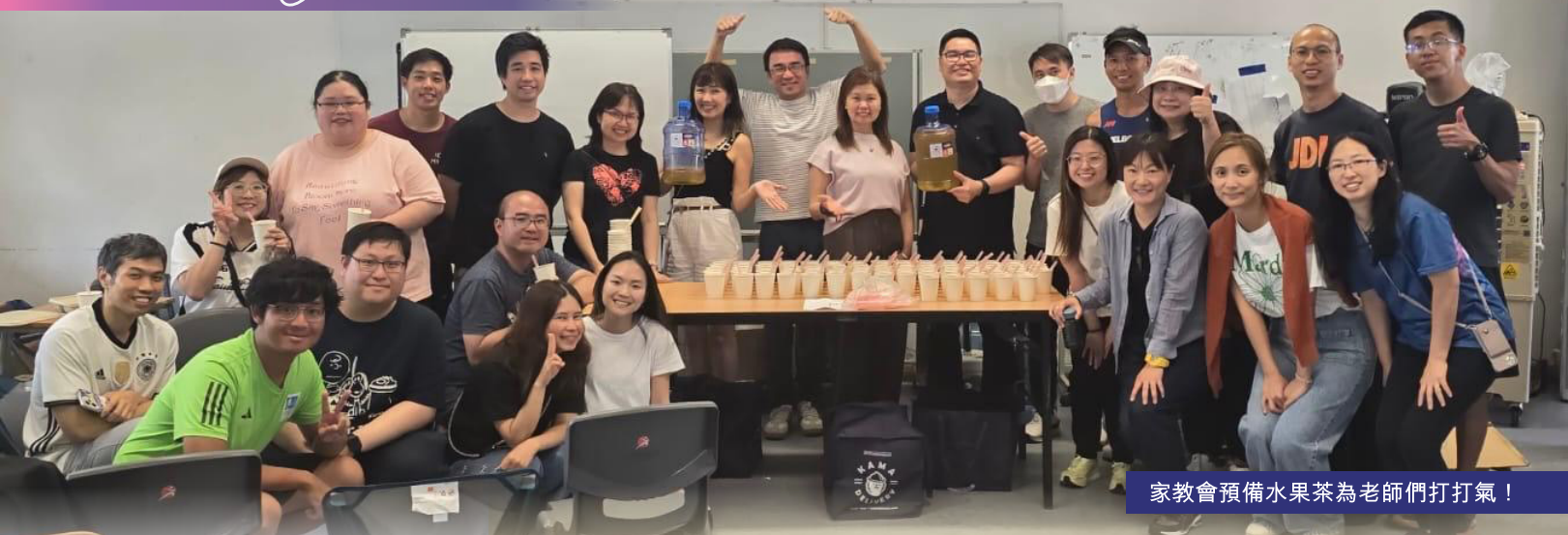
家教會預備水果茶為老師們打打氣！