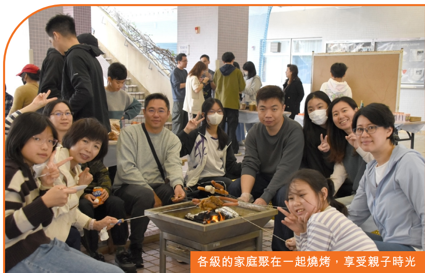
各級的家庭聚在一起燒烤，享受親子時光

親 子燒烤活動深受家長歡迎。活動在學校有蓋操場舉行，報名人數踴躍，超過100位學生、家長和老師出席。當日學校不但提供豐富的食物和精心設計的遊戲，更有老師和學生的精彩表演，因此，全場氣氛熱烈，讓大家渡過一個愉快難忘的下午。今次獲得家長和學生義工準備食物和佈置場地，令活動順利進行，在此感謝他們的支持。