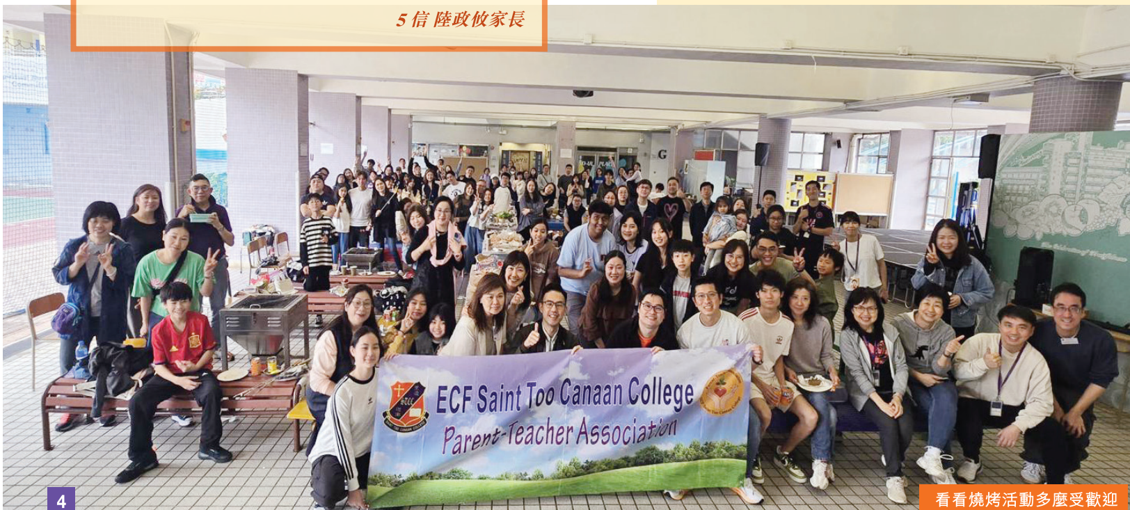
看看燒烤活動多麼受歡迎