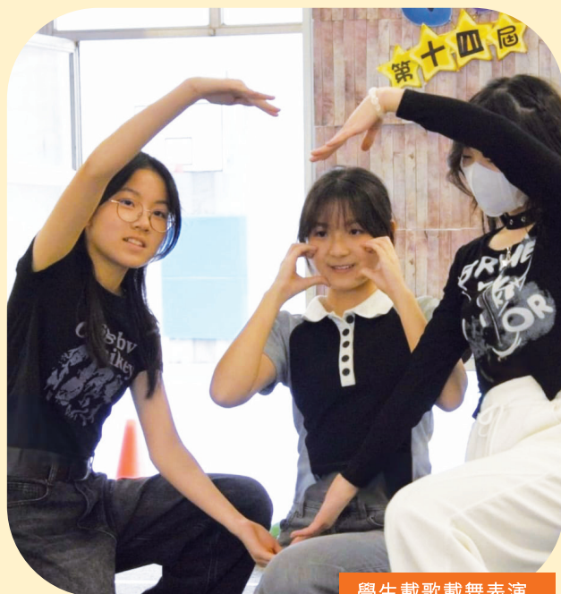
學生載歌載舞表演

作為家教會委員，連續第四年負責籌辦親子燒烤活動，事前需要親力親為，投放不少時間開會和預備，但只要見到家長和孩子們有開心難忘的時光，就覺得很滿足和有意義。